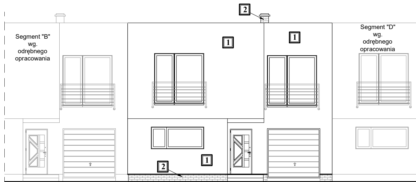
ELEWACJA FRONTOWA 1:100